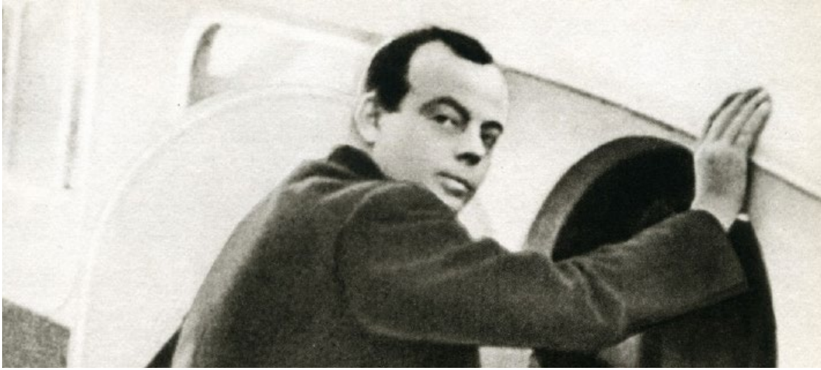
Antoine de Saint-Exupéry en 1935, peu de temps avant sa tentative de record de distance entre Paris et Saïgon.

Antoine de Saint-Exupéry , auteur du Petit Prince , le roman de jeunesse le plus lu au monde, est autant connu pour son talent d'écrivain que pour son destin tragique d'aviateur (il disparaît mystérieusement au cours d'une mission en 1944).